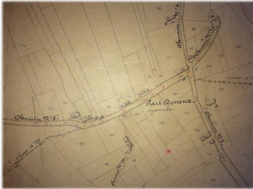
Extrait de l'Atlas des chemins vicinaux de 1841

L'inventaire des voiries communales est une opération historique puisque la première et dernière actualisation remonte aux premières heures de la Belgique, dans les années 1840 à 1850. À l'époque, en établissant ses atlas vicinaux, notre pays adoptait une attitude visionnaire et à la pointe. Cette deuxième actualisation placera la Wallonie à l' avant-garde en la matière puisque il s'agira de réitérer l'opération, mais avec les outils cartographiques les plus récents et en proposant un atlas en ligne, accessible à tous.