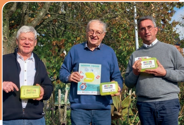
Présentation du projet avec les Bourgmestre, Président de C.P.A.S. et Secrétaire du C.C.C.A.

Votre Service Social Communal a signé, depuis quelques années, le protocole « Disparition des Seniors de leur domicile », en partenariat avec la Zone de Police des Arches, le Parquet de Namur, la Cellule de Recherches de la Police Fédérale et la Ligue Alzheimer.