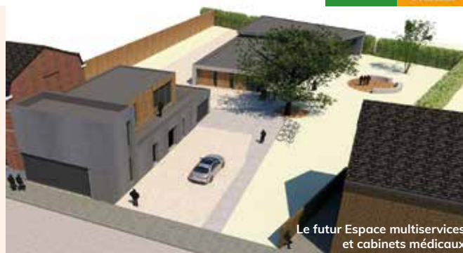
Le futur Espace multiservices et cabinets médicaux

Afin de favoriser l'économie locale et de renforcer la dynamique économique du centre du village, un atelier rural sera créé au sein du projet. En effet, la commune ne dispose